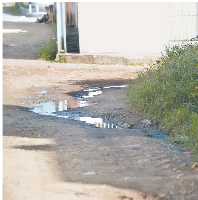
População teme contrair doenças devido ao esgoto a céu aberto

Procurada pela reportagem, a Compesa disse que “desconhece o vazamento mencionado pelo leitor” e que a busca na Central de Atendimento “não localizou qualquer registro de vazamento nessa rua, nem recente e nem antigo”. A Companhia solicita que os clientes comuniquem à empresa as questões relacionadas a seus serviços, como manutenção da rede de abastecimento (conserto de vazamento) e extravasamento de esgoto, pelo telefone 0800-081-0185. Para demais serviços e informações, o cliente deve ligar para 0800-081-0195.