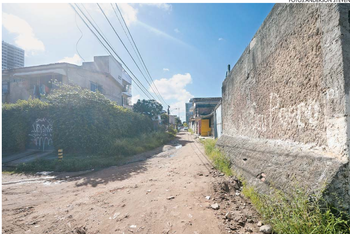
Terraplanagem só causou prejuízos, com o rompimento de canos, consertados por moradores

Procurada pela reportagem, a Autarquia de Urbanização do Recife (URB) explicou que apenas parte da rua Joaquim Távora é asfaltada (qualquer cidadão pode consultar no site www.recife.pe.gov.br/ESIG/ ), sendo um trecho com calçamento em paralelepípedo e outro em “leito natural”.